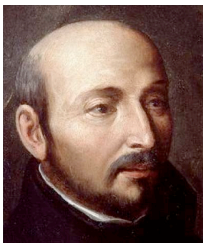
San Iñazio Loiolakoa 1491-1556

ESKERRAK EMAN X.5 Eskerrak eman, menderen mendetan Eskerrak eman Jainko Jaunari. Eskerrak eman Jaunari, eskerrak eman, Eskerrak eman Jainko Jaunari. Eskerrak eman Jaunari, Eskerrak eman Jaunari. Eskerrak eman Jaunari, eskerrak eman. Eskerrak eman Jaunari, eskerrak eman, Eskerrak eman Jainko Jaunari.