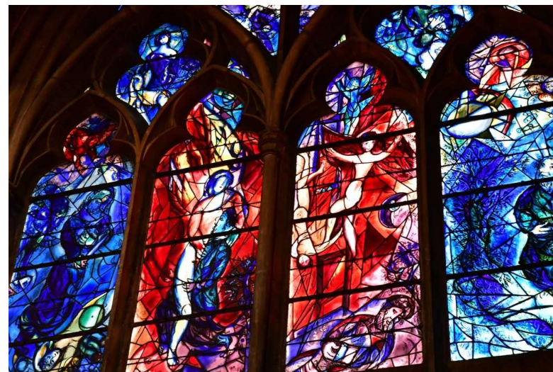
Vitrail de Chagall – Cathédrale de Metz

A l'Abbaye Notre – Dame de TOURNAY (65) du vendredi 24 avril au 26 avril 2026